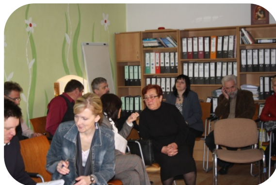
Fotodokumentácia zo školení